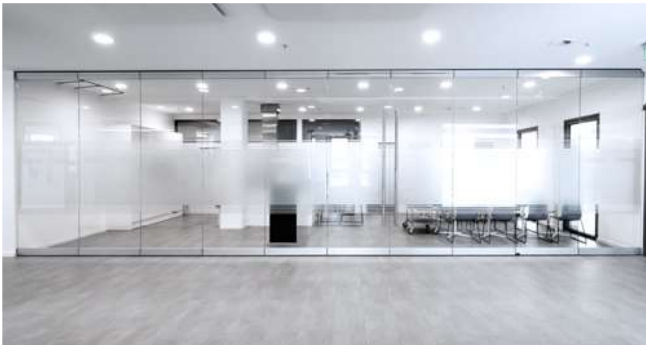
Pobočka GEZE Nord, Hamburk, Německo