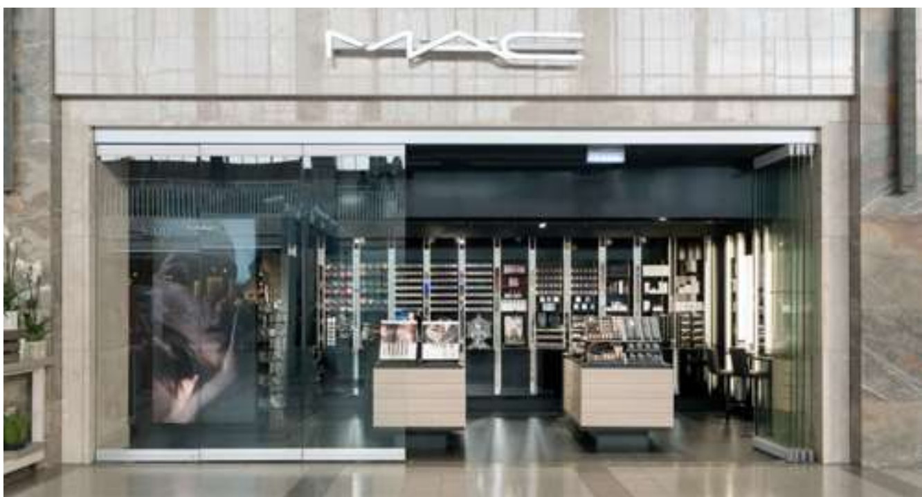
Nákupní středisko v BahnhofCity na západě Vídně, Rakousko