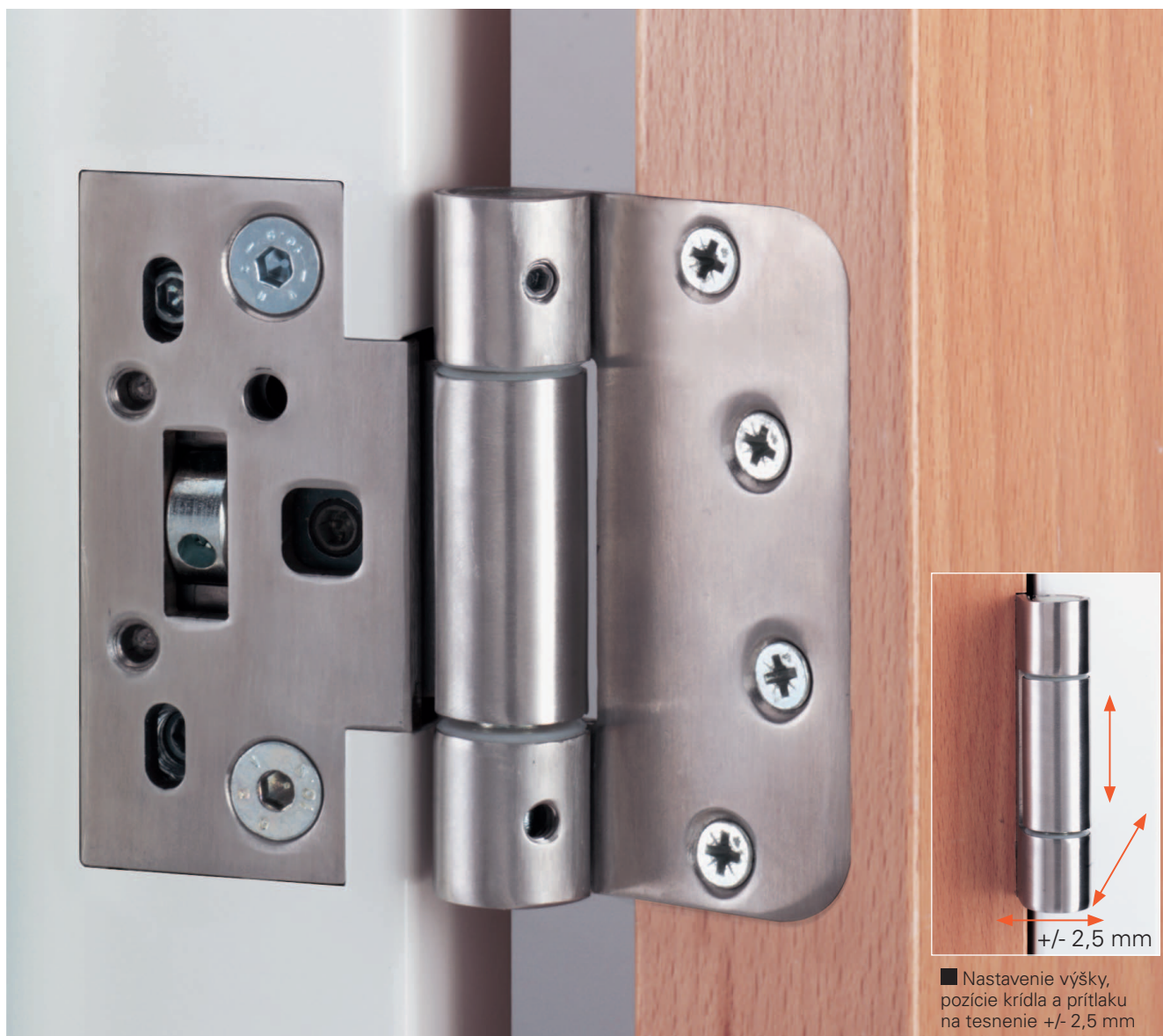
■ Nastavenie výšky, pozície krídla a prítlaku na tesnenie +/- 2,5 mm

Pant certifikován dle standardu EN 1935:2004